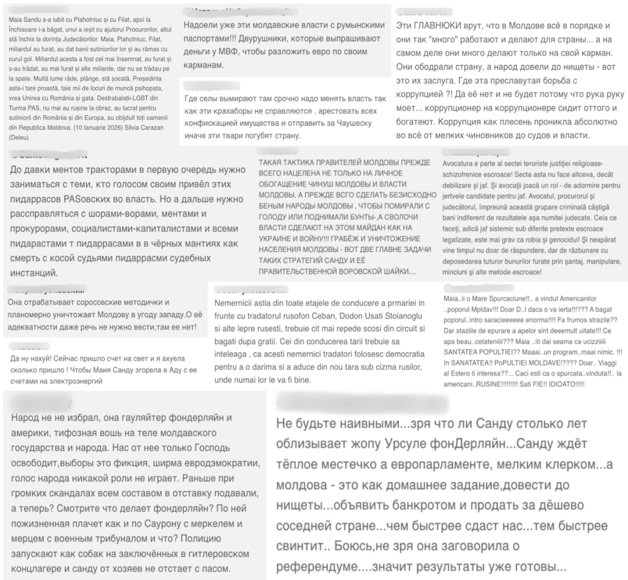
Выборка комментариев. Они были сохранены в своей оригинальной форме для иллюстрации материалов, не соответствующих стандартам YouTube.

Анализ активности пользователей указывает на преднамеренное и, в некоторых случаях, скоординированное распространение дезинформационных сообщений . В период мониторинга 2 881 пользователь опубликовал комментарии, содержащие проблемные нарративы или дезинформационные сообщения. Из них 251 пользователь отличился высоким уровнем активности, каждый из которых опубликовал не менее пяти комментариев. Вместе они сгенерировали 2 791 комментарий, что свидетельствует о значительной концентрации проблемного контента вокруг относительно ограниченного числа аккаунтов. Кроме того, 205 из этих пользователей комментировали как минимум на трех разных каналах, расширяя видимость одних и тех же сообщений в нескольких сообществах на YouTube.